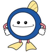
下水道マスコットキャラクター 「スイスイ」

間違った使い方は、汚水の逆流や爆発などの 重大な事故につながります。下水道は正しく使いましょう。