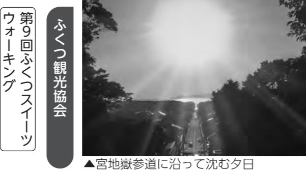
▲宮地嶽参道に沿って沈む夕日

ふくつ観光協会ホームページをご覧ください。 前祝祭 2月22日(土)、2月23日(日)午前10時～午後5時 場 イオンモール福津 内 古代衣装コンテストなど 古墳会場イベント 3月2日(日)午前10時～午後3時 場 新原・奴山古墳群 内 古墳現地説明会など カメラア会場イベント 3月16日(日)午前10時～午後3時 場 カメリアステージ 内 発掘最前線セミナーなど ふつくるのミニマルシェ 市内の直売所から、美しい花と旬の野菜を届けます。 2月11日(火・祝)、2月25日(火)午前11時から 場 福岡駅2階ふつくる ビーチハウスマルシェ 菓子や雑貨を販売します。体験ブースもあります。 2月15日(土)午前11時～午後3時 場 福岡海岸ビーチハウス ふくつ観光協会 ☎42・9988