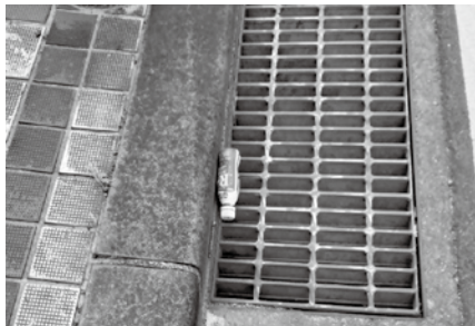
▲道路に捨てられたペットボトル

杖や高齢者の外出を手助けするシ ニアカーの通行を妨げるかもしれま せん。自分の家にごみを捨てられた らと想像してみてください。まちは あなたのごみ箱ではないのです。