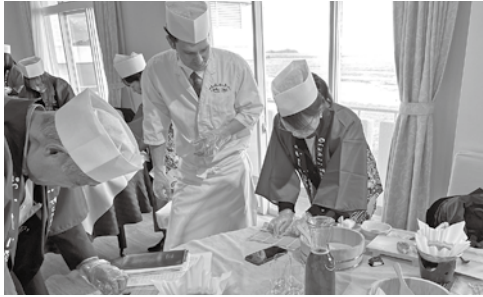
▲宿泊旅のすし学校で学ぶ参加者の皆さん

日=日時、日程 定=定員 ￥=費用 持=持参物 場=場所 問=受付、問い合わせ ☎=電話番号