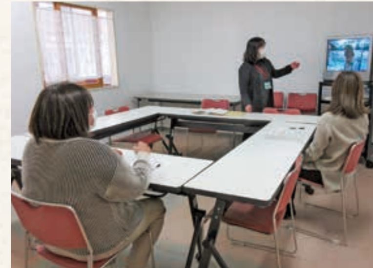
▲おねがい会員講習会で映像を見ながら事例を学ぶ参加者

具体的活動の流れは、まず、おねがい会員からセンターに援助依頼があると、センターのアドバイザーがまかせて会員に連絡し、会員同士をつなぎます。 援助活動は、安心して子どもを預けることができるよう、おねがい会員と子ども、まかせて会員、アドバイザーの三者で事前打ち合わせを行います。両者合意のもと活動を始める、まかせて会員宅での一時預かりや、保育施設に送迎するなどして、おねがい会員を支援します。 皆さんも、センターの会員として活動してみませんか。