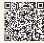
▲こどもの国ホームページ

市は、乳幼児の子育てを応援しています。みんなで手を取り合って健やかな子どもを育てましょう。こどもの国ホームページでは市内の子育て施設やサービスなどを紹介しています。