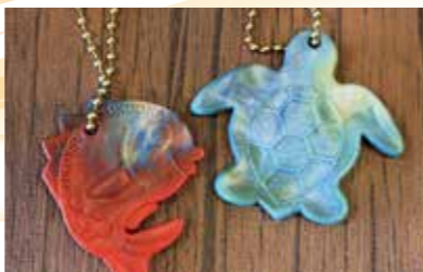
▲廃プラスチックがキーホルダーに変身