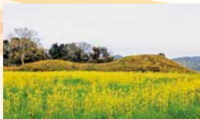
▲「世界文化遺産」新原・奴山古墳群