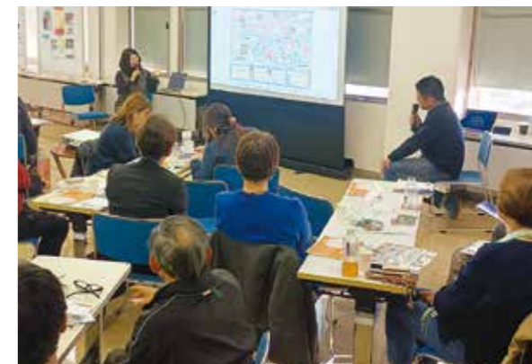
▲スクリーンの資料を示しながら活動を紹介する発表者

プログラムの最後には情報交換・交流会を実施。参加者同士で意見交換をしたり、登壇者へ質問をしたりと、自由に対話を重ね、参加者からは「普段の活動で