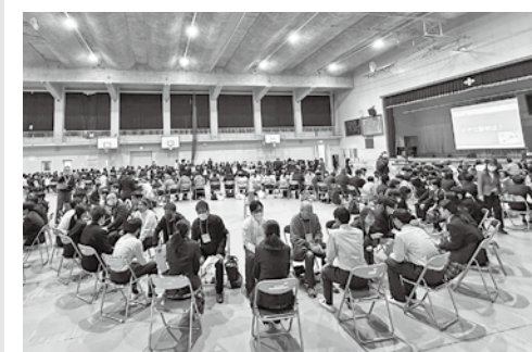
▲多世代で会話を楽しむトークフォークダンス

毎 年恒例となっている、トークフォークダンス 福岡中学校2年生とトークフォークダンス 広報ボランティアからの投稿