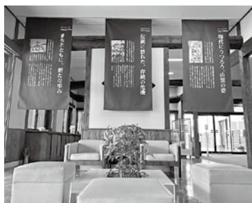
▲山笠一色に染まるなごみ館内

曜日 曜日の午前11時から午後3時には、ビーチハウスマルシェを開催しています。 7月1日(月) から水曜日を除く、午前10時30分～午後6時30分 福岡海岸ビーチハウス ふくつくるのミニマルシェ 市内の直売所から、美しい花と旬の野菜を届けます。 7月9日(火)、7月23日(火)のそれぞれ午前11時から JR福岡駅2階「ふくつくる」 ふくつ観光協会