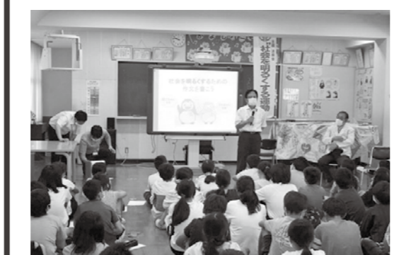
▲小学校での啓発授業

犯罪や非行を行った人たちが社会復帰をしていくためには、その人たちが孤立していくことがないように、地域の理解と協力が必要です。市内でも、保護司会や更正保護女性会が、地域からの犯罪や非行予防の相談や助言、指導などを行っているとともに、各種啓発活動の実