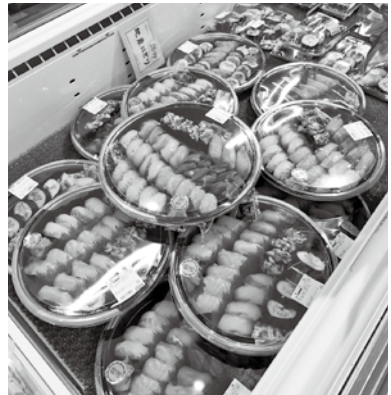
▲天然の地魚を贅沢に寿司や刺身で

お魚センターうみがめでは、お盆限定で天然 の地魚を使った寿司を販売します。8月13日 (土)、8月14日(日)の予約受付は、8月8日(月) までです。予約していない人も、当日は寿司盛り りや地魚握り、刺身など、豊富に揃えてお待ち しています。 あんずの里市 やふれあい広場 ふくまでも、ほ おずきや花、お 飾りなどお盆用 品を取り揃えて います。 皆さんのお越 しをお待ちして います。 ▲天然の地魚を贅沢に寿司や刺身で