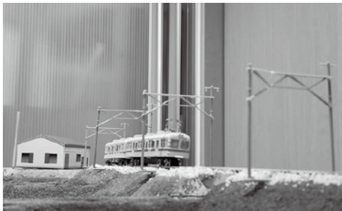
▲沿線風景をジオラマで再現しています

日=日時、日程 定=定員 料=費用 持=持参物 場=場所 問=受付、問い合わせ ☎=電話番号