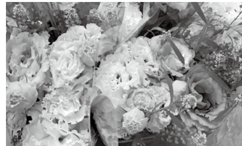
▲福津の特産品トルコギキョウも販売します

福津暮らしの旅(夏旅編) の参加者を募集中です。8 月27日(土)は「津屋崎ひが た探検」干潟の不思議生き 物を見つけよう、8月28日 (日)は「津屋崎漁港の朝市 に行ってみよう」旬の海の 幸で贅沢朝ごはんを実施 します。