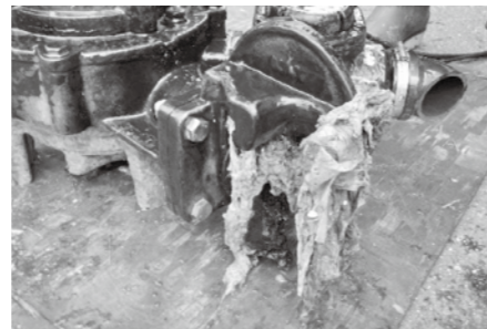
▲下水道設備に詰まった異物

井戸水を使っているかたで、その汚水・雑排水を下水道に流す場合は、下水道使用の届け出と、世帯人数に応じた下水道使用料の納付が必要です。井戸水と上水道を併用している場合は上水道分に井戸水分を加算して下水道使用料の納付が必要です。井戸水分の下水道使用料を納付していない場合、井戸水による下水道の使用の開始や中止をする場合は、宗像地区上下水道料金センターへ連絡してください。また、世帯人数に変更があった場合も料金が変わる可能性があるため、連絡をお願いします。