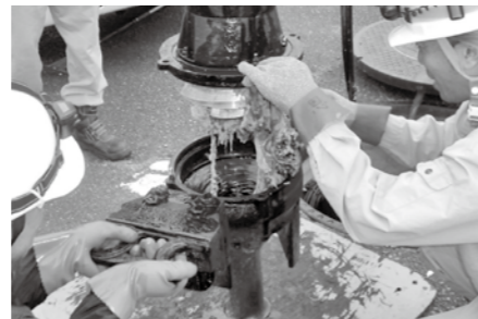
▲詰まった異物を取り除く撤去清掃作業