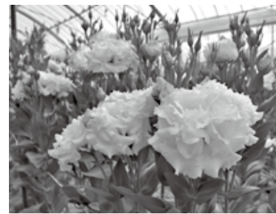
▲6月ごろまでが旬のトルコキキョウ