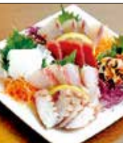
つやぎ漁港食堂 空と海 津屋崎4-47-18-2F ☎52・5001