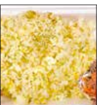
らー麺 味噌哲 中央5-7-11 ☎43・3133