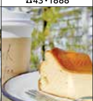
patisserie & cafe anju / Withcoffee 西福岡5-33-4/中央6-6-15 ☎51・4685