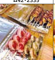
やきとり 陽 宮司1-6-18 ☎52・6007