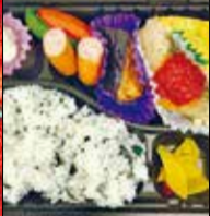
田ぐり庵 花見が浜3-5-13 ☎39・5539