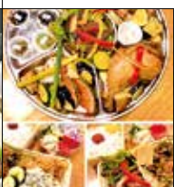
六蔵 中央4-22-30 ☎43・1888