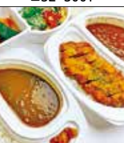
華カリー ジンジャー 福岡駅東1-2-15 ☎42・8528