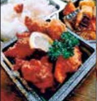
博多わび助 福岡店 福岡駅東1-2-15 ☎42・2900