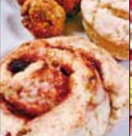
Canada Kitchen 津屋崎5-22-3 ☎52・2080