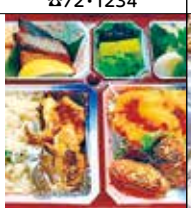
居酒屋 又兵衛 中央3-8-3 ☎42・0067