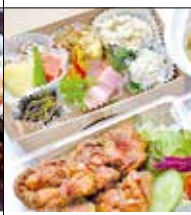
Kitchen ナカシマ 中央1-19-7-1F ☎72・6630