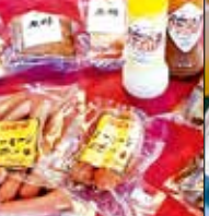
レストラン ハイポー 福津店 西福岡2-20-1 ☎43・2200