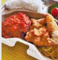
Seaside Kitchen MIU 津屋崎4-44-6 ☎72・4619