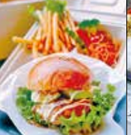
marutani 中央3-2-6-2F ☎43・8370