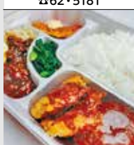
洋食屋 かもまつ 中央6-10-1 ☎42・0108