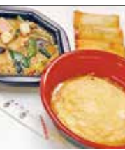
中華料理 春香 西福岡1-10-15 ☎42・5143