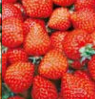
くわの農園 本木1074 ☎090・9471・3263