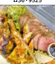
BOCCO VILLA /cafe de BoCCO 西福岡4-15-37 ☎34・3050