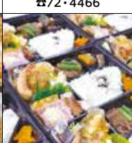
ふじや 中央6-20-5 ☎42・6944