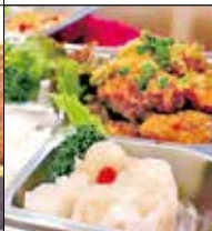
Kitchen King 日蔭野3-1-119 ☎62・5511