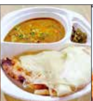
インド料理 ニューサイン 手光南1-6-1第3山田ビルG ☎42・1995