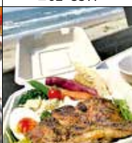
LANDSHIP cafe 宮司浜4-5-17 ☎52・0381