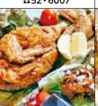
ちどり屋 江藤 中央1-14-8 ☎43・7876