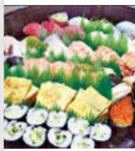
寿し 神力 宮司浜1-17-17 ☎52・5808