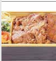
焼肉・すきしゃぶ おんどう 福津海洋通り店 西福岡4-5-12 ☎55・1129