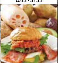
ハートフルバーガー 宮司2-1-10 ☎52・0772