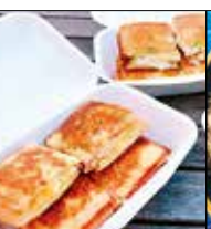
HOT SUNS 西福岡3-27-26 ☎72・1234