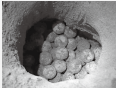
▲浜に産卵された卵