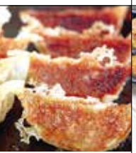
ぎょうざの山八 中央4-19-15 ☎0120-583-888