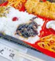
大磯 西福岡4-15-17 ☎43・1151