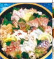
漁師・割烹 安徳丸 中央2-5-1 ☎42・2335