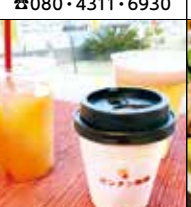
あじあんカフェ&バルピンタン 渡1892-46 ☎62・6322