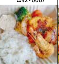
キッチン☆たなか 手光1872-1 ☎080・4311・6930