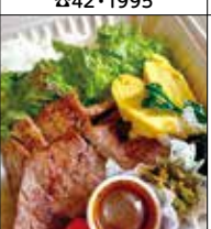
一步一笑紙屋 吉祥 中央6-9-11 ☎72・6033