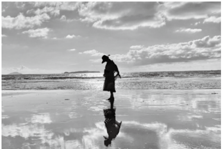
▲ぬれた砂浜に空が映るかがみの海

日=日時、日程 定=定員 料=費用 持=持参物 場=場所 問=受付、問い合わせ 電=電話番号