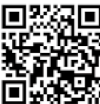
▲福津市電子図書館 QRコード

貸出点数 3点 貸出期間 15日間 問い合わせ 市立図書館 ☎42・8000、 カメラアステージ図書館 ☎72・1207