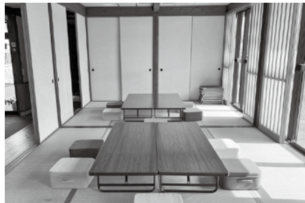
▲二間続きで使えば広々と使用できます

日=日時、日程 定=定員 費=費用 持=持参物 場=場所 問=受付、問い合わせ 電=電話番号