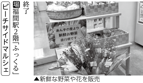
▲新鮮な野菜や花を販売