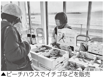
▲ビーチハウスでイチゴなどを販売