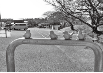
▲名称は「小鳥付車止め」

オブジェにも、温かい多くの思いが込められていることがわかりました。皆さんも街中にあるオブジェに注目し、それぞれに込められた思いを味わってみてはいかがでしょうか。