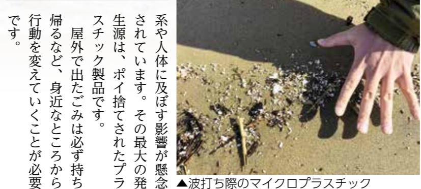
▲波打ち際のマイクロプラスチック

マイクロプラスチックについて マイクロプラスチックとは、5mm以下の細かいものを指しますが、大きく分けると次の2種類があります。一つ目は、洗顔料などのスクラブ材に利用されている、もともとマイクロサイズで製造された「一次的マイクロプラスチック」です。二つ目は、大きなサイズで製造されたものが、紫外線や波などの作用によって破砕・細分化されて細かくなった「二次的マイクロプラスチック」です。