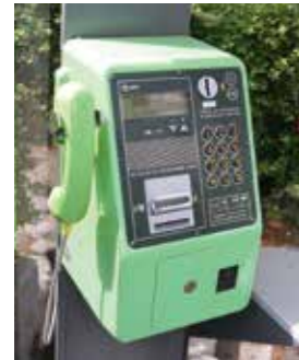
▲市役所前バス停近くに設置してある公衆電話

いざというときに備え、子どもと一緒に公衆電話の場所を確認し、電話の掛け方を練習するのも、大切な防災教育です。