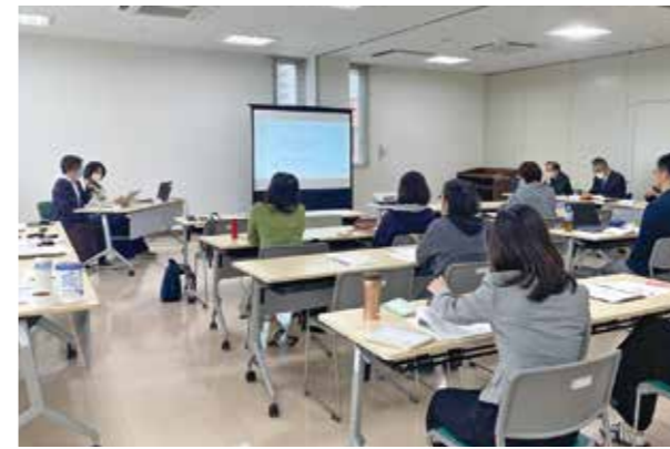
▲地域との連携について話す「どの子ども凸凹プロジェクト実行委員会」

問い合わせ 市消費生活相談窓口 ☎43・8106 (毎週月曜・水曜・金曜日の午前9時～午後4時) ※県消費生活センター ☎092・632・0999 でも、随時相談を受け付けています