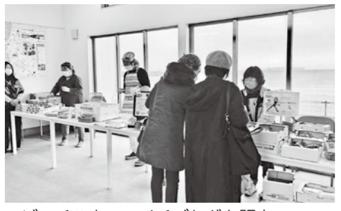
▲ビーチハウスでイチゴなどを販売

観光協会の会員を中心にビーチハウスで色々なものを販売するマルシェです。きれいな夕日とかがみの海で注目される福津の海の爽やかな風と共に、楽しい思い出をお持ち帰りください。 6月15日(木)、6月30日(金) 午前11時～午後3時 場市観光情報ステーション ビーチハウス 問 ふくつ観光協会 ☎42・9988