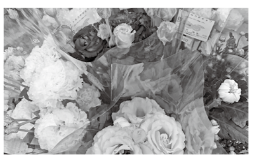
▲新鮮な野菜や花を販売

市公式ホームページへの投稿 マイナポイントって市役所に行かないともうええなの？ マイナポイントの申請期限は9月末です。ただし、マイナンバーカードの申込手続きを2月末までに行っている必要があります。期限間近は混雑が予想されます。マイナポイントの申請を検討している人は、余裕を持って手続きをお願いします。 粗大ごみ回収を有料化する理由は？ 令和5年7月から粗大ごみ回収が有料化されるとい話を聞きました。今さら有料にする理由は、(40代/男性)市が粗大ごみ回収を有料化する理由は主に次の3点です。まず、粗大ごみ排出量の削減です。市民一人当たりの粗大ごみ排出量は年々増加している有料化によって、排出量削減を目指します。次に、排出量に応じた負担の公平化です。収集や処理に関する経費を、排出量に応じて負担してもらい、負担の公平化を図ります。最後に、環境を意識した生活様式の定着です。有料化によってものを大切にすることを促し、資源循環型のまちづくりを推進します。皆さんのご理解をお願いします。