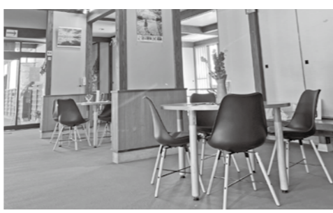
▲カフェ席が快適になりました