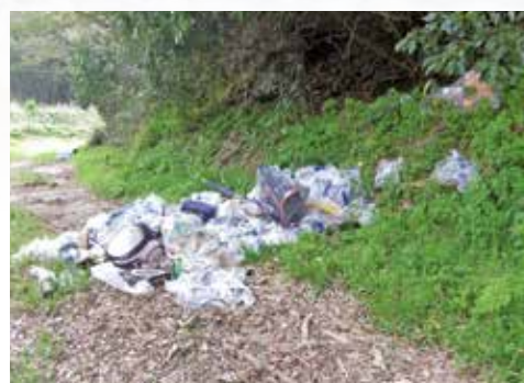
▲市内で発見された不法投棄

不法投棄をすると法律によって、5年以下の懲役または1千万円以下の罰金、もしくはその両方と非常に重い罰が科せられる場合があります。