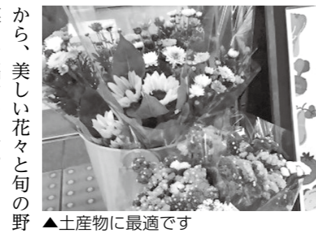
▲土産物に最適です

津屋崎千軒なごみ 7月15日(土)の裸参りの日は、午後9時まで開館時間を延長します。なごみ前を通る勇壮な裸参りをぜひお楽しみください。荒天の場合は裸参りは中止で、なごみは通常開館(午後6時まで)になります。なお当日は、なるべく公共交通機関を利用してください。