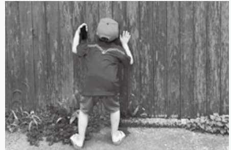
▲穴の向こうの世界をのぞいてみませんか

付きでスポットを巡るプロローグツアーを開催します。スタートは津屋崎千軒なごみです。