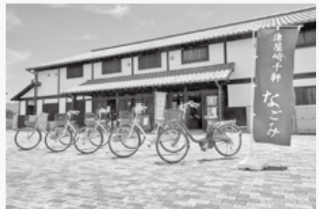
▲自転車で福津を満喫しましょう

など詳しくは、ひかりのみちDMO福津公式ホームページ(福津WAVE)をご覧ください。