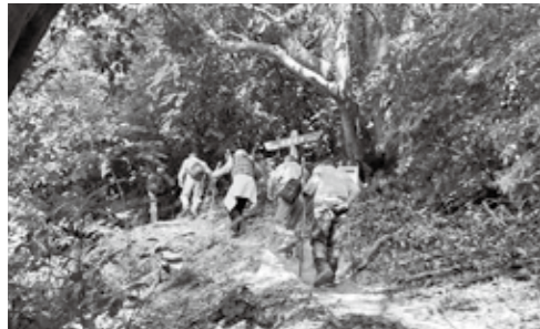
▲秋の運動にはトレッキングが最適です

日=日時、日程 定=定員 料=費用 持=持参物 場=場所 問=受付、問い合わせ 電=電話番号