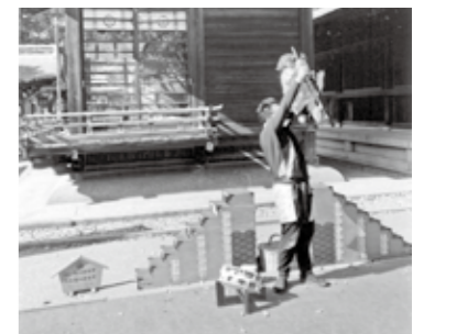
▲猿回しの途中で猿を高く抱え上げる猿回しの親方

が成功して得意気に胸を張る猿。それに満足し、幸せな気分になる人々。桜吹雪と猿回しは、宮地嶽神社によく似合う。