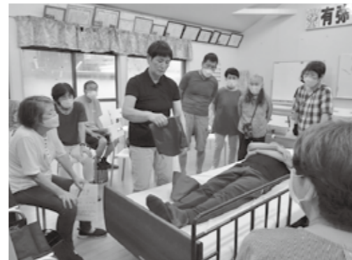
▲ベッド移乗を体験する介護教室参加者

問い合わせ 市社会福祉協議会 ☎34・3341 市高齢者サービス課 ☎43・8191