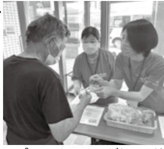
▲ピンクのTシャツがトレードマークです

食進会は、食と健康づくりについて学習会を開催し、その学びを料理教室や啓発活動などさまざまな活動を通して市民の皆さんに伝えています。