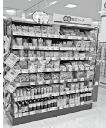
▲イオン福津店に設置された適塩コーナー

また、市内小売店に設置されている「適塩コーナー」では食進会が作成した適塩レシピの配布をしています。ぜひ、今晚のおかずの参考にしてください。