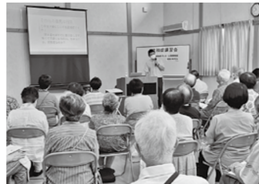
▲講師の話をうなずきながら聞く受講者

今年度は7カ所での開催が予定されていますので、興味があるかたはぜひご参加ください。