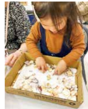
▲貝殻を選ぶ子ども

持続可能性(サステナブル)をテーマにさまざまな取り組みを紹介する「サステナブル2023」が10月28日～11月5日の9日間、イオンモール福津で開催されました。地域商社いざい協力のもと行った福津市、宗像市の特産品を集めた「ふむふむマルシェ」や、プラスチックごみ削減講座とエコバック作りが行われた花王グループ・カスターマーマーケティング株式会社ブース。他にも、福津市の海岸で拾った貝殻を使った貝殻鑑づくりでは、自分の好きな貝を選び、自分だけの図鑑を作りました。参加者からは「いろいろな貝があって、全部福津で拾えることに驚いた」「実際に海に拾いに行きたい」などの感想がありました。また、市内7つの小学校が