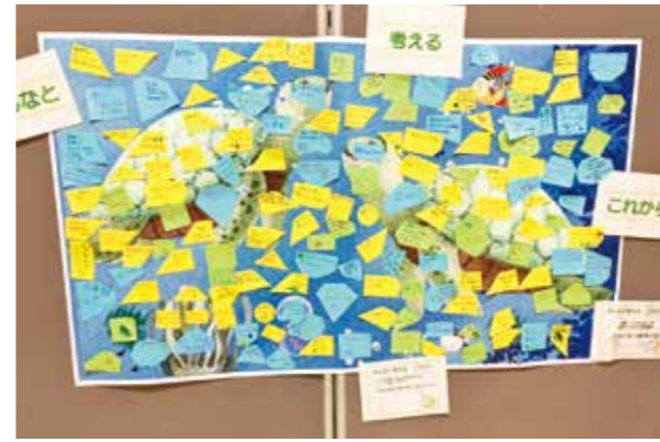
▲来館者の「これから」で埋められた絵

問い合わせ 市消費生活相談窓口 ☎43・8106 (毎週月曜・水曜・金曜日の午前9時～午後4時) ※県消費生活センター ☎092・632・0999 でも、随時相談を受け付けています