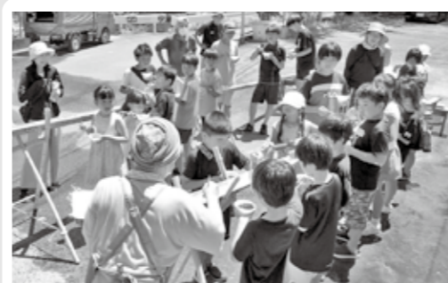
▲竹で作った長いそうめん流しに大喜びの児童

今年度は3年ぶりに、デイキャンプを開催しました。朝9時に集合して夏休みの宿題を済ませたら、ライフジャケットを着用し、上西郷川でエビやメダカの観察、水遊びをしました。昼食は自治会の皆さんが作ってくれた流し台で、そうめん流しを体験し、午後はスカットボールや輪投げなどのニュースポーツをして遊びました。夕食は保護者や卒業生、兄弟も含め総勢53人でカレーライスを作り、子どもたちはもちろん、大人も楽しく過ごせた一日でした。