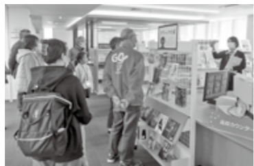
▲図書館探検で館長の説明を聴く受講生

「カメラステージ図書館を利用する楽しみ～電子図書館を使ってみよう～」の講座を11月25日にカメラステージ図書館で開催しました。講座の前半では、電子図書館の具体的な活用方法について図書館のホームページを見ながら学びました。後半では図書館施設探検を行い、書架の構成や特徴、企画展示の説明を聞くことができ、受講生からは「運営の工夫を知ることができ有意義だった」「自分も電子図書を利用してみたい」などの感想がありました。図書館の新しい使い方を学ぶことができ、受講生も興味津々でした。