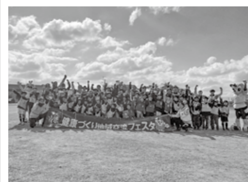
▲アビスパ福岡のコーチと参加者で集合写真

健康づくり地域交流フェスタ in 福津が11月19日に津屋崎小学校で開催されました。このイベントは、アビスパ福岡のコーチと一緒に、子ども・親・シニアの3世代での世代間交流と健康増進を図ることを目的としています。約80人が参加し、大いに盛り上がりました。さまざまな世代で、1つのボールを楽しそうに追いかけて、一体感ある、とても素晴らしい時間となりました。参加者からは「とても楽しかった。来年もぜひ開催してほしい」との声が多くありました。