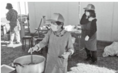
▲団子汁を振る舞うボランティア

読者の皆さんから寄せられた、市内の出来事や旬の話題をお届け 今回はU・Tさんからの投稿です プリンセス駅伝 10月22日。快晴。この日は第9回全日本実業団対抗女子駅伝競走大会予選会プリンセス駅伝の日。この大会で16位以内に入賞すると、全国大会であるクイーンズ駅伝への切符を手にすることができる。 午後0時10分に宗像ユリックスをスタート。私はあんずの里運動公園で沿道から、毎年のように応援する。選手を応援する各企業の応援団が駆け付け、和やかな雰囲気の中にも、ライバル同士どこか殺気立つような空気を漂わせている。 大会関係の車両やパトカー、白バイが通り過ぎ、先導車が近付いてくると、我先にと身を乗り出す沿道の人々。歓声が沸き上がる中、選手はまるで韋駄天のように走り抜ける。 沿道の人々をもてなすボランティアの人は大忙し。振る舞われた団子汁をあちらこちらに腰掛けながら、多くの人が食べている。私もいただいたが、とてもおいしかった。 地元九州のチームが入賞するとやはりうれしい。宗像・福津は実業団女子チームにとって、重要な場所になった。この中から、日本一になるチームが生まれることを毎年願っている。