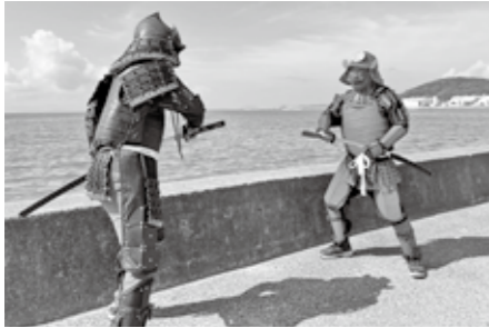
▲ドラマの一場面のような写真も撮影できます

日=日時、日程 定=定員 料=費用 持=持参物 場=場所 問=受付、問い合わせ ☎=電話番号