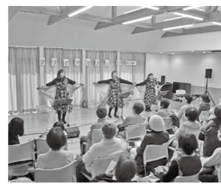
▲3人の歌に観客は聴き入っていました

読者の声を中心に、市民の皆さんと広報広 聴係で作る交流コーナーです。広報ふくつの 感想や市政へのご意見、ふるさと福津市への 思いや日々の生活のことを掲載します。たくさ んの声をお寄せください。 電話による投稿 息子を助けてくれた コンビニの店員さんへ 1 月25日の夜、福岡市内の 大学から帰宅途中の息子 が、博多駅から久留米方面の電 車に乗らなければならぬといこ ろ、急いでいて小倉方面に間 違って乗ってしまいました。 間違いに気付いた息子は福岡 駅で降りましたが、すでに終電 の時間を過ぎていました。 精神障がい2級の息子は人と 話すのが苦手で、そのときの所 持金もわずか。しかも翌日は、大 学の試験の日。途方に暮れた息 子は近くのコンビニまで歩いて 向かい、とりあえず始発まで待 とうと缶コーヒーを1本買って、 時間を過ごすことにしました。 しばらくすると60代くらいの 男性店員が声を掛けてくれまし た。息子が事情を話すと「始発ま でどこか温かい場所まで過しな さい」と2千円を渡してくれま した。感謝しつつも返金などに ついて息子が尋ねると「困って いる人がいたら、あなたが同じ ように助けてあげて」と返さな くてもよいということでした。 息子はその後、近くのファミ