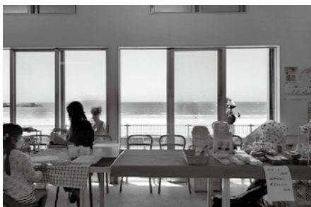
▲美しい海岸も楽しめます

4月6日(土)、4月13日 (土)、4月27日(土)のそれ ぞれ①午前11時から、②午 後2時から ※所用時間約 60分