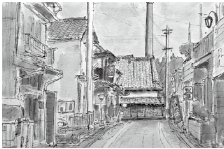
▲津屋崎千軒を描いた作品

日=日時、日程 定=定員 料=費用 持=持参物 場=場所 問=受付、問い合わせ ☎=電話番号