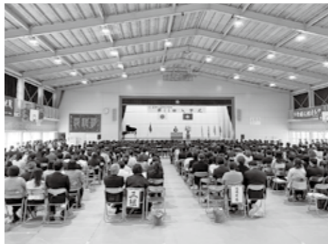
▲新入生に加え多くの保護者が参列していました

読者の声を中心に、市民の皆さんと広報広聴係で作る交流コーナーです。広報ふくつの感想や市政へのご意見、ふるさと福津市への思いや日々の生活のことを掲載します。たくさんのお声をお寄せください。