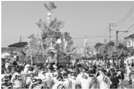
▲館内では山笠の映像も放映します

日=日時、日程 定=定員 料=費用 持=持参物 場=場所 問=受付、問い合わせ 電=電話番号