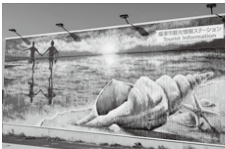
▲新しくなったウォールアート

観光協会の会員を中心に菓子や雑貨を販売し、クラフト体験も行います。新しくなったウォールアートも必見です。