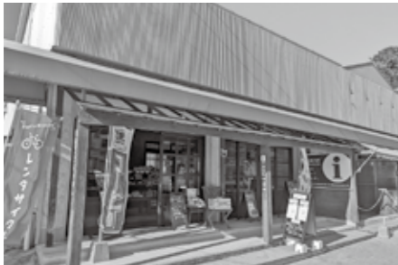
▲開放的な雰囲気です立ち寄りやすいです

えてきそうな、勇壮な写真の数々をご覧ください。6月23日(日)〜7月27日(土) 津屋崎千軒なごみ 52・2122