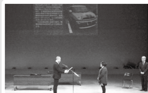
▲原崎市長から表彰状が授与されました

市青少年育成市民の会は、小・中学校やPTAによる家庭の教育力の向上や豊かな心の育成を目的とした活動への支援を行っています。昨年度は、各学校の環境美化活動や、スマホの適切な利用に向けた学習、伝統文化継承活動などの支援を行いました。