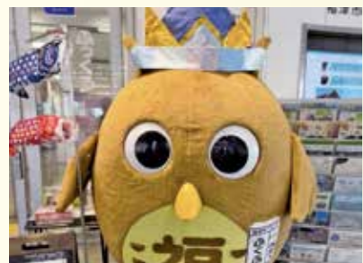
▲端午の節句を彩る「ふくふくちゃん」

ふくふくちゃんがお待ちしています。なお「ガラポン抽選会」の参加条件は、ふっくる窓口で確認してください。