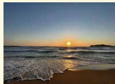
▲福津の海に沈む美しい夕日