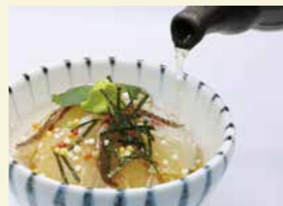
▲福津のご当地グルメ「鯛茶づけ」

📅=日時、日程 📍=場所 🎯=対象 📄=定員 💲=費用 🎭=講師、出演者 🧳=持参物 📧=受付方法 📅=受付期間・期限 📞=問い合わせ