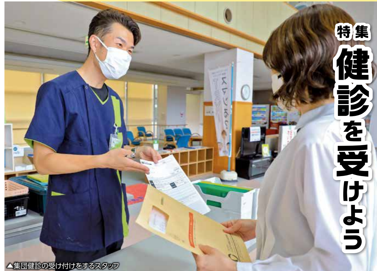
▲集団健診の受け付けをするスタッフ