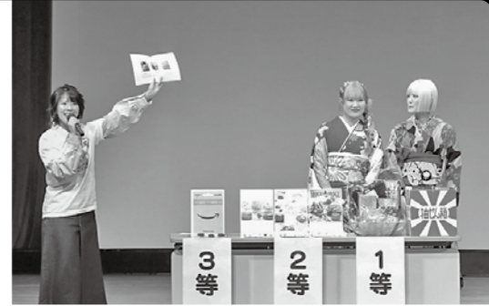
▲式典内で行った福引き大会