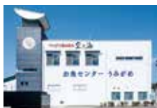
お魚センターうみがめ