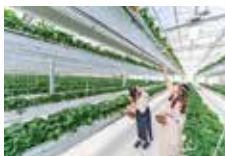
スカイフロラファーム