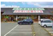
ふれあい広場ふくま