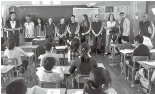
▲小学校を訪問した若手主体の選手たちとコーチ

福津市と古賀市は柔道ルーマニアチームの東京2020オリンピック事前キャンプ地です。 問い合わせ 市郷育推進課 ☎62・5079