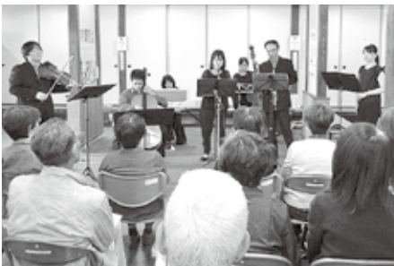
▲演奏に聴き入る来館者の皆さん