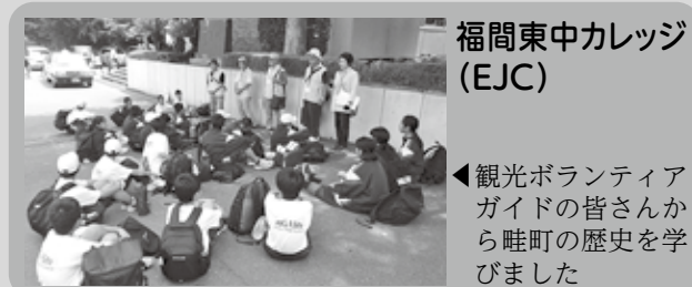
福間東中カレッジ(EJC)