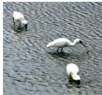
▲干潟でエサを捕るクロツラヘラサギ