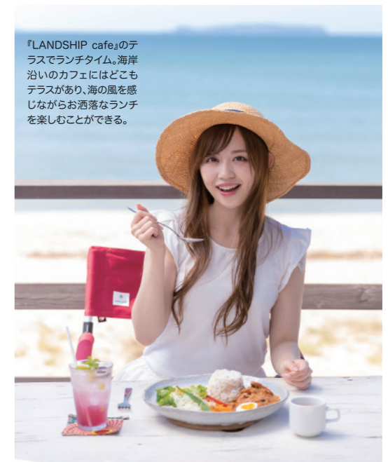
『LANDSHIP cafe』のテラスでランチタイム。海岸沿いのカフェにはどこもテラスがあり、海の風を感じながらお洒落なランチを楽しむことができる。

福岡海岸の人気カフェ「カフェドボッコ」の2号店として2018年にオープンしたアジアンテイストのビーチリゾートカフェ。福岡海岸を目の前に、広いテラスに出るもよし、店内の涼しげなラタンチェアに腰掛けるもよし。人気のピッツアの他、「レモンステーキ」や「カマンベールのアヒージョ」を味わいつつ、空と海の色の移ろいをゆったり眺めていられる贅沢な時間が楽しめる。また2階には宿泊可能なゲストルームもオープンするなど、さらに進化を続けている。