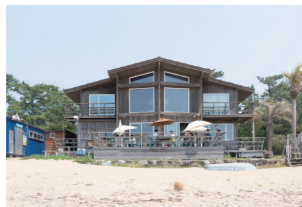
浜辺から見る「LANDSHIP cafe」の外観は左右対称の独特な形が印象的。

〒 福津市宮司浜4-5-17 ☎ 0940-52-0381 🕒 11:30~19:00(OS18:00) 10月~2月は~18:00(OS17:00) 🚫 火曜 📍 7台