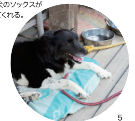
看板犬のソックスが迎えてくれる。