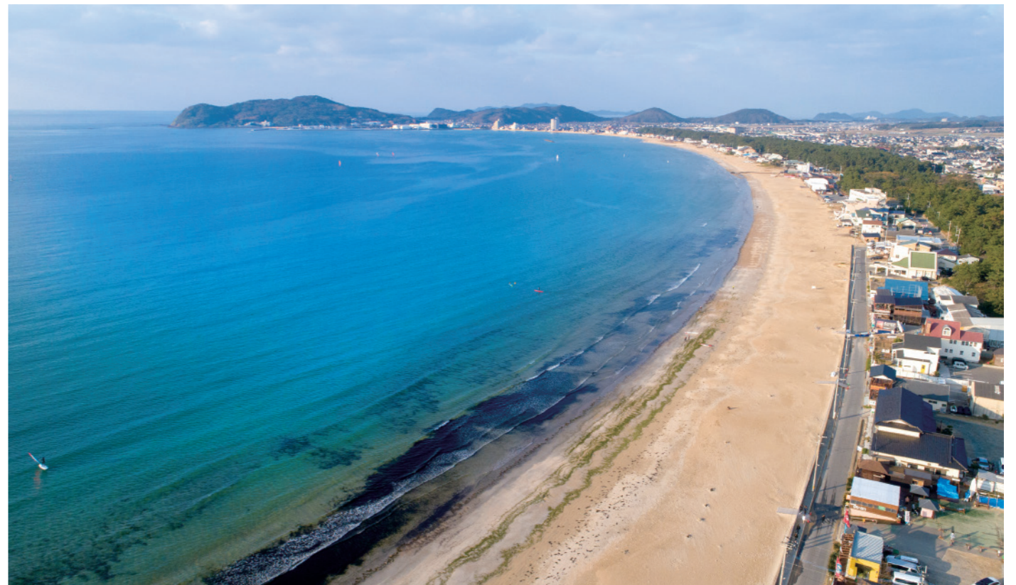
津屋崎海岸、宮地浜、福岡海岸と続くおよそ2kmのビーチに沿って、民宿やサーフショップ、カフェなどが建ち並び、夕暮れ時には夕陽の見物スポットとして人気の海岸だ。