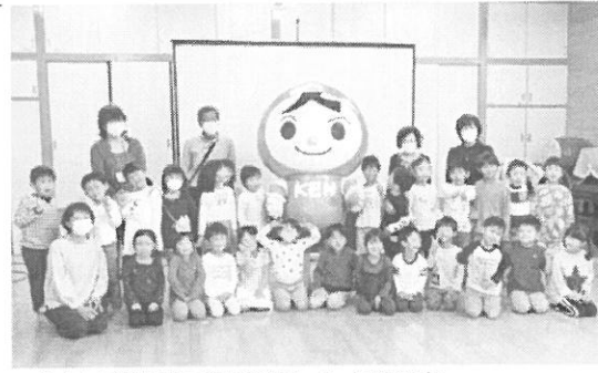
▲昨年大和保育所で開催した人権教室

ヒマワリの種をまき、花を咲かせたそれぞれの施設では、10月に人権擁護委員による人権教室「一人にやさしくできる勉強会」を行います。