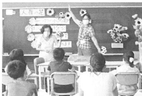
▲勝浦小学校で行われた人権学習

勝浦小学校では、6月に人権擁護委員と一緒に人権学習を実施し「人権」について考えました。一連の活動は、12月の「子どもたちの作品展」で紹介する予定です。