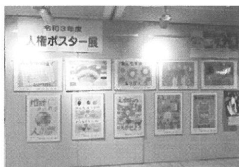
▲昨年度の人権ポスター展の様子

市内外の小・中学校、高等学校の児童や生徒が作成した、人権ポスターや人権標語「男女がともに歩む」一行詩の表彰作品を展示します。