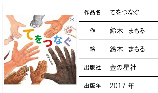
令和5年度に購入した絵本