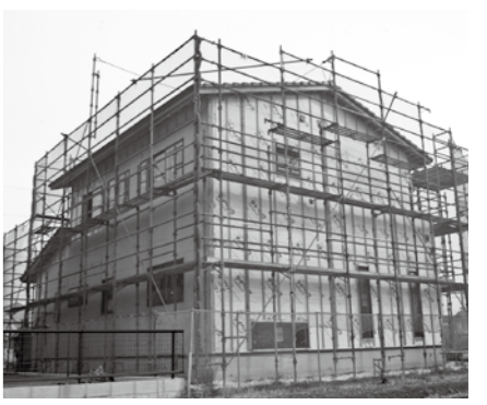
▲定住化促進を図ります。新築時は御相談を