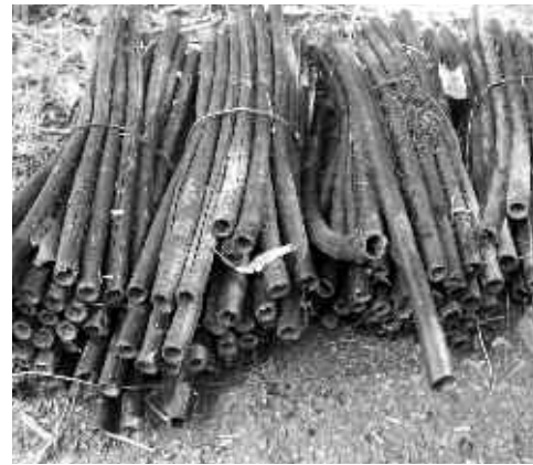
▲業者が捨てたと思われる金属を抜き取った後のごみ