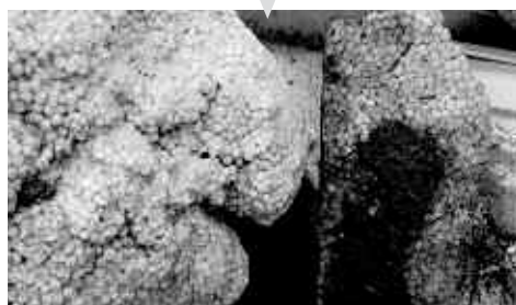
▲発砲スチロールごみ かなり劣化していて粒状になる一歩手前