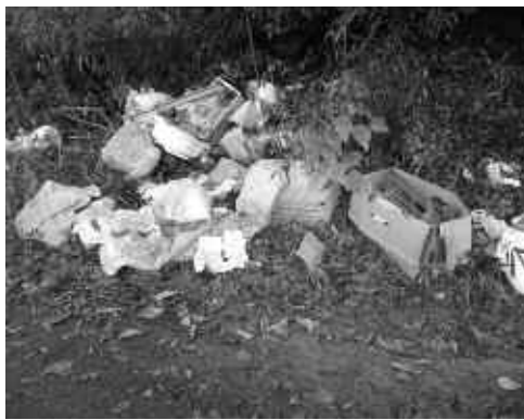
▲山間部に捨てられた大量の生活ごみ

ま ちのごみは、海の漂着物だけではなく、山間部などでの不法投棄も多く発生しています。最近の傾向としては、業者が投棄したものと思われる銅線や金属部分を抜き取った後の不要物、家の片付けのときに出了たと思われるごみなどを、大量に捨てるケースが増えています。このような不法投棄は、当然捨てた人が罰せられるべきですが、こういったことが起こる背景として、業者に処理内容をよく確認せず、依頼していることも原因の一つと