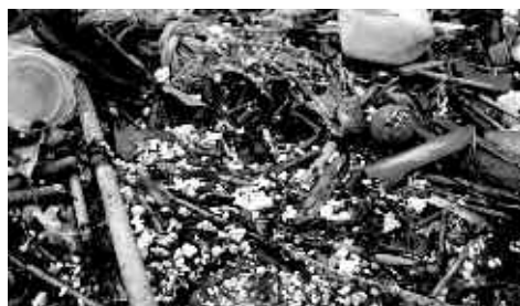
▲粒状になった発砲スチロールごみ こうなってしまうと回収が難しくなります