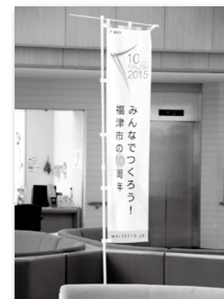
▲ふくとびあ(ロビー)