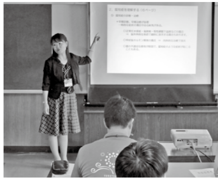
▲事業所向けの認知症サポーター養成講座

表紙の子どもたちのように、認知症サポーターの証しであるオレンジリングを付けた人を見つけたことはありませんか？ 認知症サポーターとは、地域で暮らす認知症の人やその家族を応援する人のことです。認知症について正しい知識を持ち、その知識を友人や家族に伝えたり、今までより少し地域の高齢者に目を向けて、困っている人がいたら声を掛けたりする、それがサポーターの活動です。できる