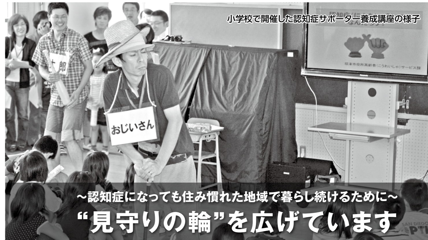
小学校で開催した認知症サポーター養成講座の様子

～認知症になっても住み慣れた地域で暮らし続けるために～ “見守りの輪”を広げています