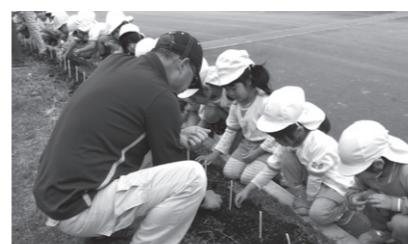
▲こうみょうの丘(4月27日)

今年、津屋崎小学校と、福津いくみ保育園、こうみょうの丘でひまわりの種をまきました。種まきは、人権擁護委員会をはじめ、保護司会や更生保護女性会の皆さんに手伝っていただきました。 また、10月には種をまいたそれぞれの施設で人権擁護委員による「一人にやさしくできる勉強会」を行います。 大輪の花を咲かせるひまわりのように、人権尊重の意識が市内の隅々まで広がっていくことを願っています。