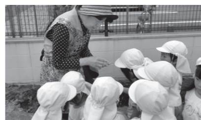
▲福津いくみ保育園(4月20日)