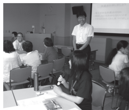
▲講師派遣事業の様子