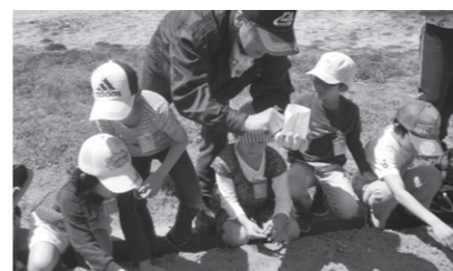
▲津屋崎小学校(4月19日)

県の人権啓発活動ネットワーク協議会では、ひまわりを人権の花として定めています。これは、ひまわりが外国で「太陽の花」と呼ばれていること、花言葉が「あなただけを見つめる」ということに由来しています。 人権の花運動は、ひまわりを育てることを通して、生命の尊さや協力の大切さを実感してもらうことを目的としています。 市では、平成20年度から毎年、市内の小学校1校と幼稚園、保育所2園(所)で取り組んでいます。