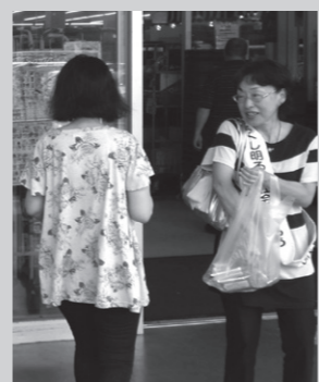
▲昨年の街頭啓発の様子

・JR福岡駅、午前7時30分～ ・ルミエール福津店、午後1時30分～ ・レガネット福津、午後3時30分～