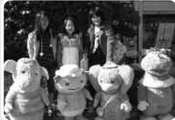
同時開催された「NHK ふれあい放送体験」のようす