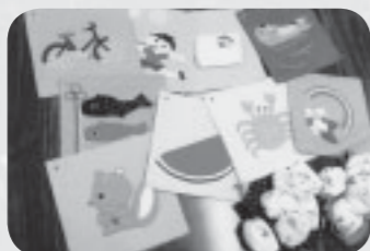
▲被災地に贈る布絵本とお手玉