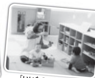
「いいものできたよ!!」 「それなあに?」