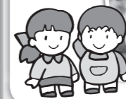
なかよし汽車遊び!!