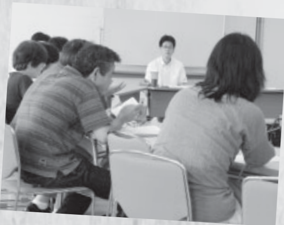
▲講師派遣事業の様子

市では、人権教育・啓発活動推進のために講師派遣事業を実施しています。 この事業は、企業・行政区・シニアクラブ・各種団体（小学校、高校のPTAなど）の求めに応じて講師を派遣し、人権教育・啓発活動を行っています。 講師を派遣しますので希望する場合は、市人権政策課まで問い合わせください。