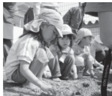
▲いどり真愛保育園

ひまわりは「人権の花」と言われています。市では平成20年度から、毎年、市内の小学校、幼稚園、保育所（園）の協力を得ながら、ひまわりの種を植える活動、「人権の花運動」を展開しています。 今年度は福岡保育所、いどり真愛保育園、上西郷小学校の3カ所で行います。 また、各施設の花壇整備などでは、保護司会や更生保護女性会、そして人権擁護委員会の皆様のご支援をいただいています。 大輪の花を咲かせるひまわりのように、人権の意識が市のすみずみまで広がっていくよう願っています。