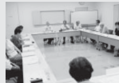
▲郷づくり協議会との懇話会の様子

これから、アンケートや懇話会でいただいた貴重な意見を参考にしながら、カレッジでできること、今後向かうべき方向性を話し合っていきます。今後も皆さんの協力をお願いします。