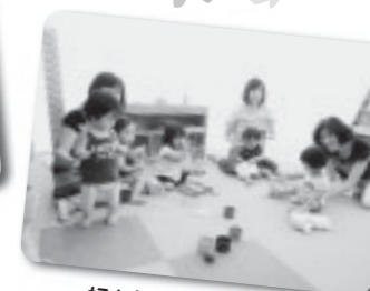
好きな遊びで大満足!