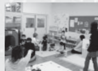
▲子どもも親も楽しく交流