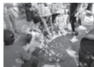
▲みんなで貝殻釣り