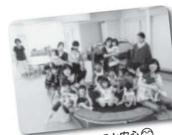
☺仲間があると安心☺ 双子ちゃんたち、勢揃い!