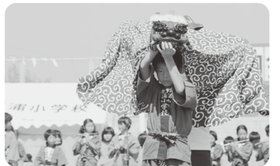
運動会での獅子楽の発表