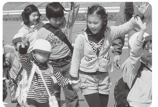
上級生が下級生に道路の渡り方を指導