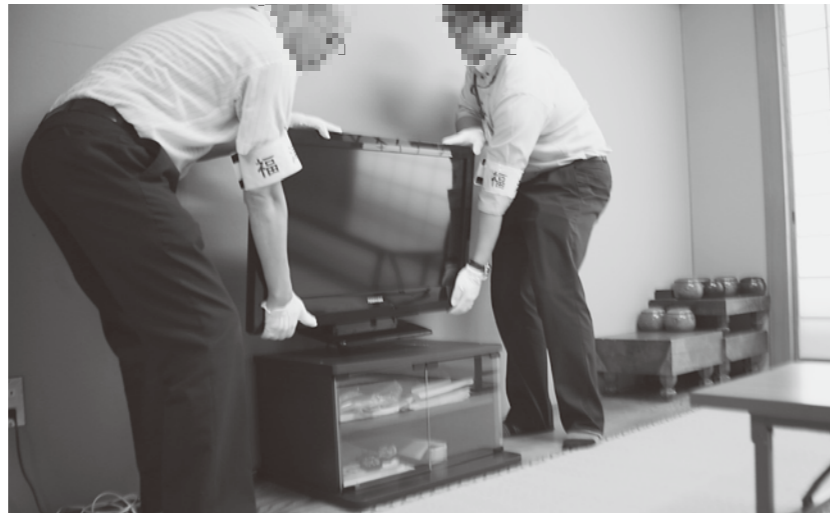
テレビなども差し押さえます

督促状や催告書を送付しても滞納が解消されない場合、財産調査の一環として、実際に滞納者の自宅や事務所に赴き、捜索を行います。捜索では動産などをその場で差し押さえ、生活状況を把握するための資料を調査します。差し押さえた物は公売会やネットオークションで売却し、滞納税に充てます。